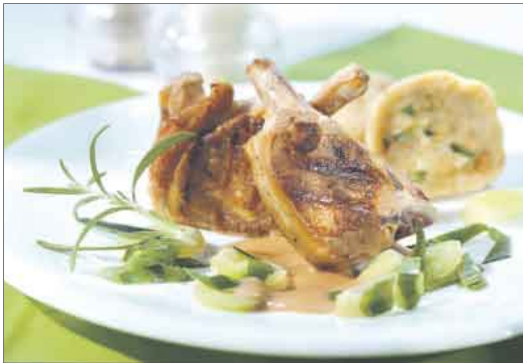
Lammfleisch ist in der Zubereitung vielfältig, stets zart und einfach lecker.

bücher. So werden beispielsweise viele der kräftigen indischen Currys mit Lammfleisch zubereitet. Rosmarin und Knoblauch gehören in der mediterranen Küche unausweichlich zu Lammbraten oder Lammkeulen. Der größte Teil des Lammfleischs, das bei uns verzehrt wird, kommt übrigens aus Neuseeland. Doch jetzt im Frühjahr, und damit passend zur Osterzeit, gibt es selbstverständlich auch frisches Lammfleisch aus der Region.