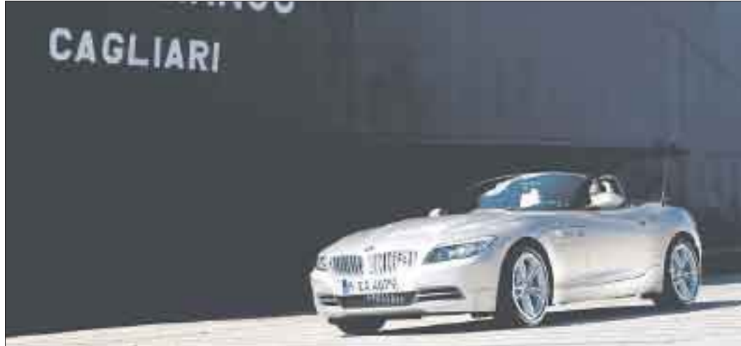
Bei der Premiere wurde mit dem neuen BMW Z4 ein Bild gemalt, dabei dienten die Reifen als Pinsel – aber auch sonst ist der neue Roadster ein ungewöhnliches Auto.

Mit dem fünften Golf GTI kehrte dieser Mythos 2004 stärker denn je zurück. Zwischen dem Debüt der ersten und dem Auslauf der fünften Generation machten mehr als 1,7 Millionen Käufer den GTI zum Weltbestseller. Jetzt folgt der sechste GTI, noch schärfer und souveräner als alle anderen zuvor. Ein GTI, dessen Fahrwerk mit serienmäßiger elektronischer Quersperre (XDS) Kurven und Traktion neu definiert. Ein 240 km/h schneller GTI, der mit seinem 155 kW / 210 PS starken Turbomotor noch mehr Spaß macht und doch nur 7,3 Liter Super bleifrei (minus 0,7 l/100 km) verbraucht. Ein GTI, der mit einem Soundgenerator und neu konzipierter Abgasanlage (je ein Endrohr links und rechts) hörbare Dynamik bietet. Ein GTI, der consequent die Tradition der Ur-Version in die Zukunft transportiert.